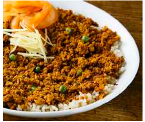
ドライキーマ (中辛)