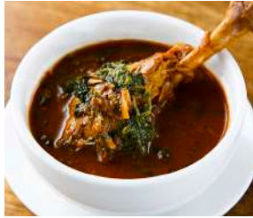
ほうれん草とチキン