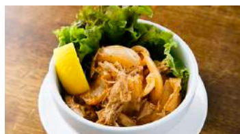
Chicken and Achar's mayonnaise