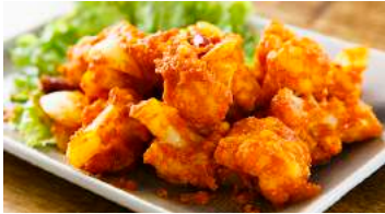
トマトの酸味がアクセントのインド風野菜炒め 野菜のスパイス炒め 各種 (カリフラワー / なす / オクラからチョイス) 528円(税込580円)