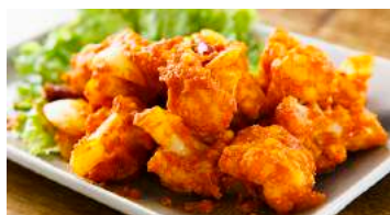
Stir-fried vegetables with spices (choice from Cauliflower / eggplant / Okura)