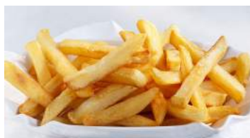
Spicy fried potato