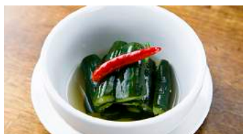
Pickled cucumber in Nampula