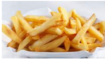
オリジナルのガラムマサラを使用 スパイシーフライドポテト 437円(税込480円)