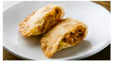
キーマチーズサモサ 382円(税込420円)