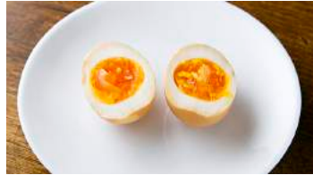
キーマとの相性がなぜか絶妙!おつまみにも 酢たまご 137円(税込150円)