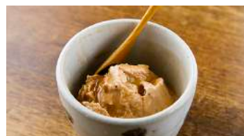
Homemade chai ice cream