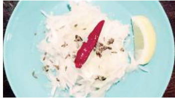
レモンをしぼってどこまでもさっぱりと 大根とクミンのサラダ 537円(税込590円)