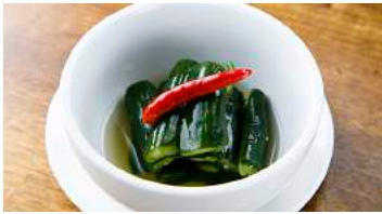
オープン当初からの定番メニュー きゅうりのナンプラー漬け 382円(税込420円)