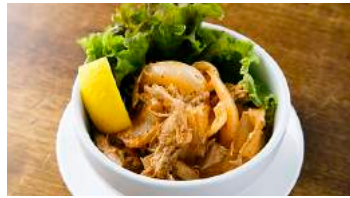
マヨネーズで食べやすく仕上げました グラム粉入りの弾力ある生地にとろけるチーズ チキンとアチャールのマヨネーズあえ 382円(税込420円)