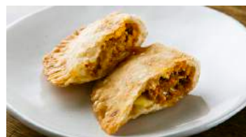
Kheema Cheese Samosa