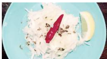
Salad with radish and cumin