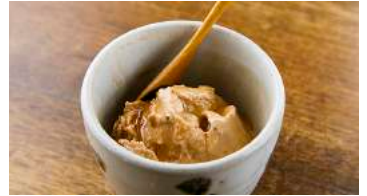
苦みのきいたカラメルソースつき 自家製チャイアイス 346円(税込380円)